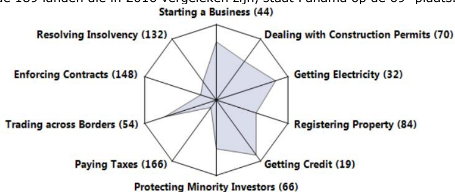
Figuur 2: Panama's ranking per factor (Doing Business 2016)

Voordat men begint met zaken doen en/of vestigen van een bedrijf in Panama is het goed om een aantal praktische zaken uit te zoeken. Jaarlijks brengt de Wereldbank per land een rapport uit waarin the ease of doing business wordt beschreven aan de hand van de 10 onderstaande factoren en de factor regulering van de arbeidsmarkt . Van de 189 landen die in 2016 vergeleken zijn, staat Panama op de 69 e plaats.